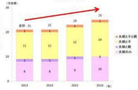
図表4 世帯類型別に見た夫婦ともに年収700万円超の世帯数の推移